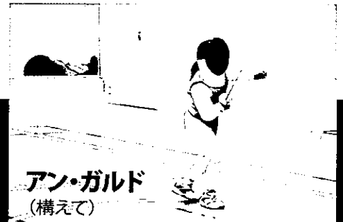
アン・ガルド (構えて)