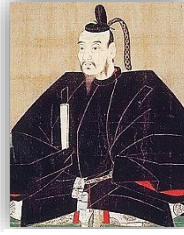
あきのときのかみ 浅野土佐守