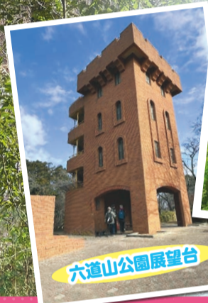
六道山公園展望台