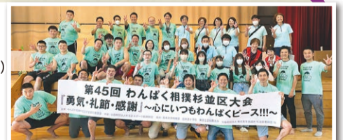
第45回 わんぱく相撲杉並区大会 「勇気・礼節・感謝!」～心にいつわんぱくピース!!!～

主催：わんぱく相撲杉並区大会実行委員会 / 共催：(公財)杉並区スポーツ振興財団 / 後援：杉並区・東京商工会議所杉並支部 / 協力：日本大学相撲部・(公社)東京青年会議所杉並区委員会 等