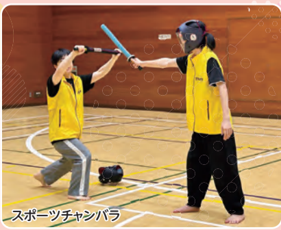
スポーツチャンバラ

共催 杉並区スポーツ・レクリエーション協会、 公益財団法人 杉並区スポーツ振興財団