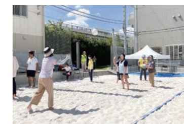
障害者対象のわいわいスポーツ教室