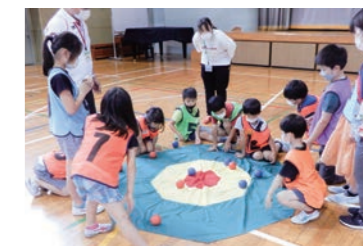
小学校でのポッチャ体験教室

児童館や小学校、地域からの依頼に応じ、レクリエーション種目やポッチャなどのパラスポーツ体験・指導を行います。他に区の事業や、大会の運営スタッフ等、幅広く活動しています。