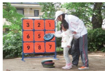
公園でのディスクゲッター体験

地域ごとのグループに分かれ、日頃スポーツをあまりしない人に向けたプチイベントを企画!どなたでも参加できるよう、身近な公園などでスポーツを始めるきっかけづくりのお手伝いをします。